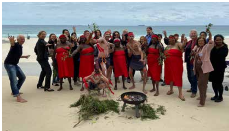
La compagnie de danseurs Noongar Moorditj Minang Jinna et les interprètes d'AIWA lors de la cérémonie de la fumée, Conférence nationale de l'AUSIT 2021